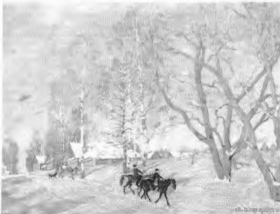
Юон К. Ф. «Мартовское солнце»