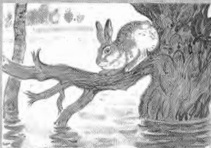
Картина А. Н. Комарова «Наводнение»